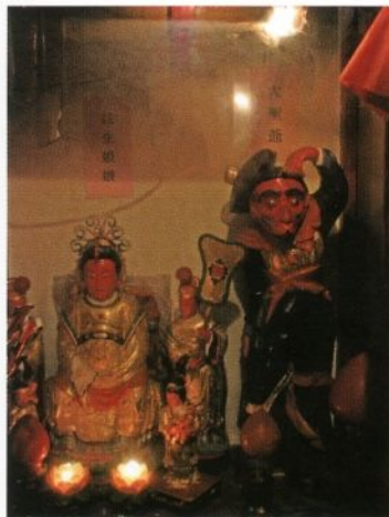
圖 1-1 主祀觀世音及彌勒佛的「靈濟寺」，殿側祀註生娘娘（娘娘媽）和齊天大聖（大聖爺）

雖說信仰對象無分佛道，但在廟務經營管理及信眾來源（祭祀圈）方面，以佛教神觀世音、釋迦牟尼佛祖等為主祀或單祀對象的佛寺，和以法主公、大帝、聖母、王爺等道教及民間諸神為主祀和從祀神的宮廟，仍有顯著的區別。