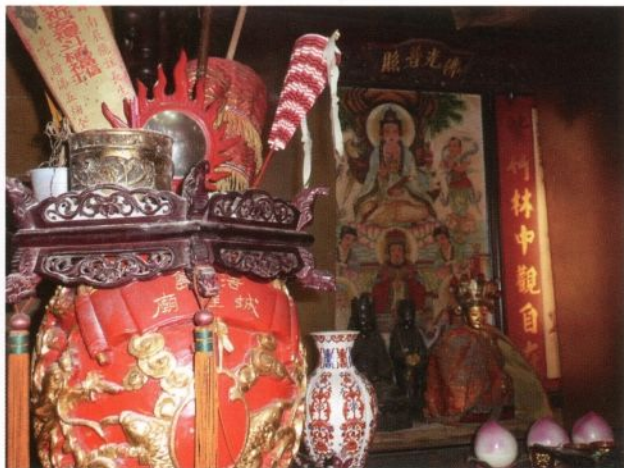
圖 1-2 後浦浯島城隍廟右殿祀觀音佛祖